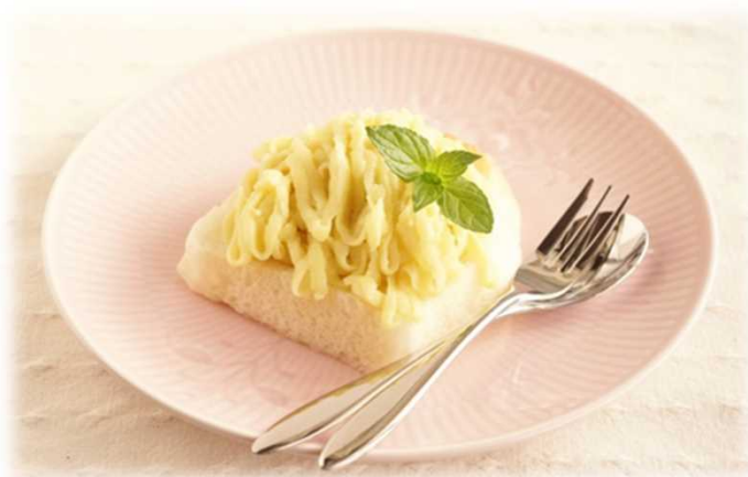
レシピ盛り付け例